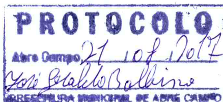
Márcio Moreira Vítor Prefeito Municipal